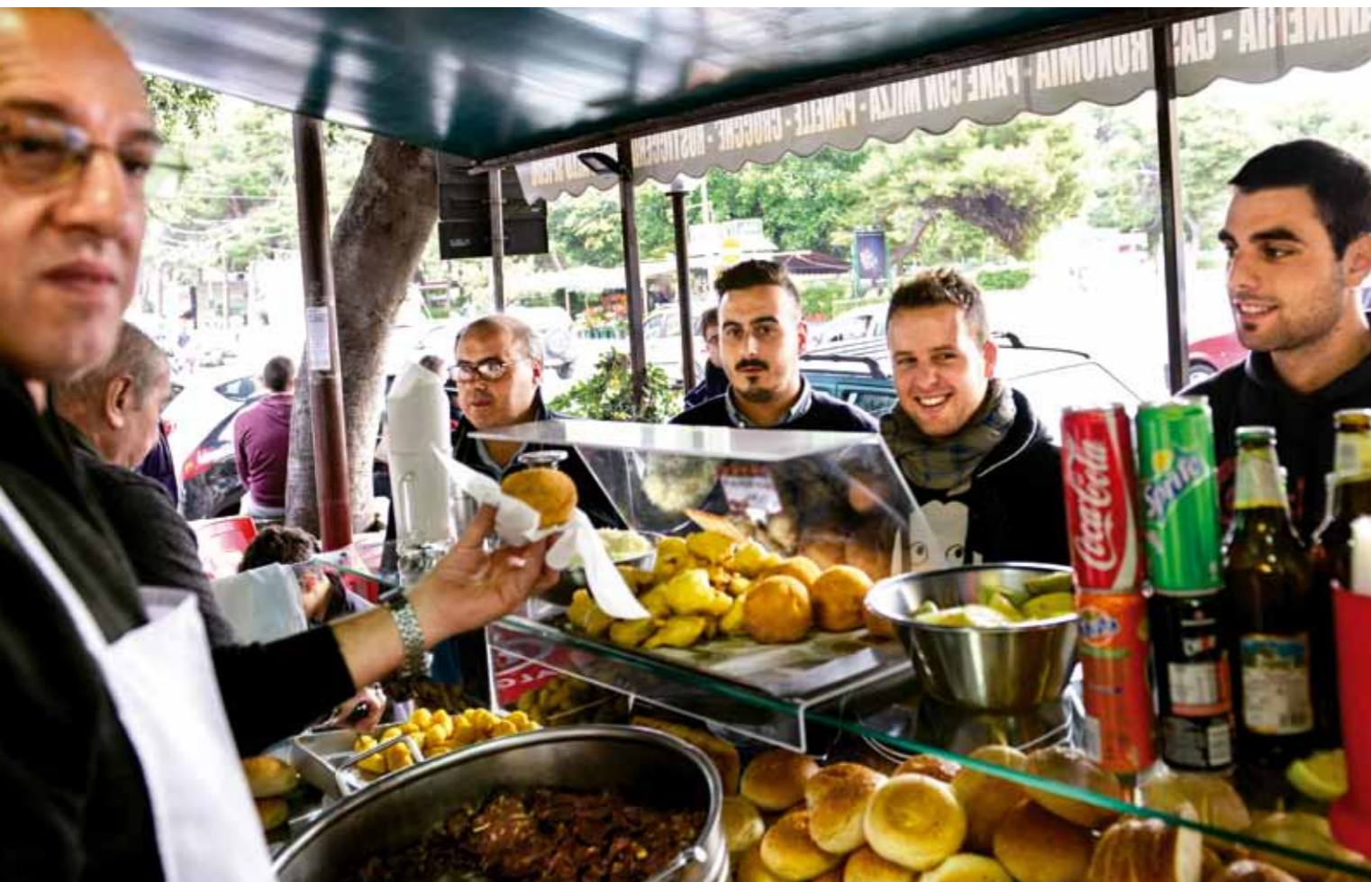
A small arancini stall near the Piazza Indipendenza, in Palermo (opposite). (From left) Teatro Massimo; customers leave Pasticceria Matranga. Arancini are made with high-quality rice (above).