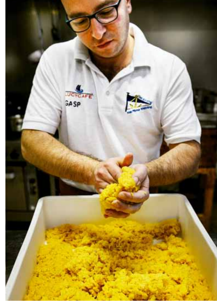
팔레르모의 인디펜덴차 광장 인근에 자리 잡은 아란치니 노점(왼쪽 페이지). 마시모 극장, 파스티체리아 마트라ంగా에서 쇼핑을 마치고 나서는 사람들(왼쪽 아래, 맨 아래). 아란치니는 이탈리아산 쌀 중에서도 최상급 쌀로 만든다(위).